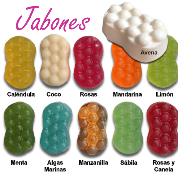
Caléndula Coco Rosas Mandarina Limón